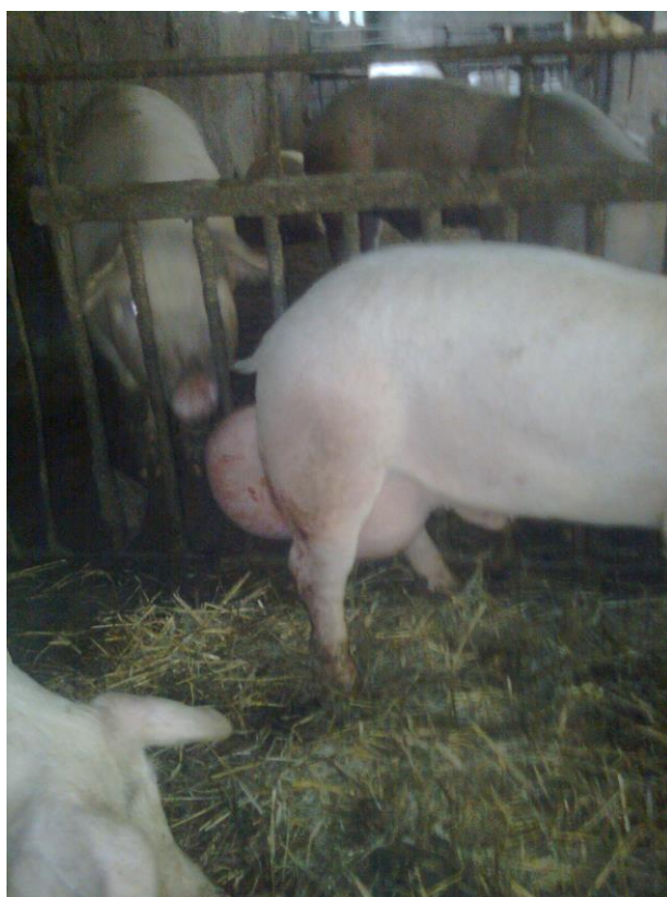
Liela trūce bez bojājumiem.

Dzīvnieka vispārīgais veselības stāvoklis ir labs. Ja tiks nodrošināti pārvadājuma apstākļi (piem., nodalīšana utt.), kas neļaus dzīvniekam gūt traumu, dzīvnieku drīkst pārvadāt nelielos attālumos. Tāds dzīvnieks pārvadājuma laikā būtu īpaši jāuzrauga.