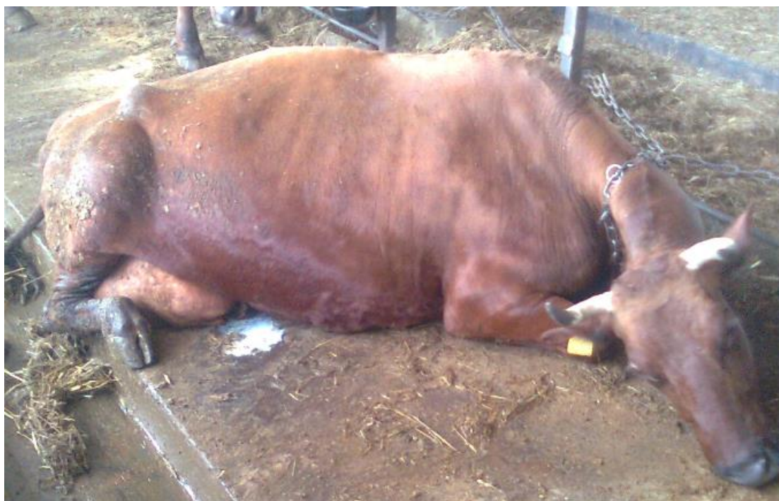
Guļošs dzīvnieks - nav spējīgs piecelties vai nostāvēt kājās