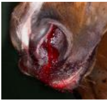
Asiņošana no deguna.

Spēcīga un ilgstoša asiņošana liecina par nopietnu ievainojumu. Pārvadāšanas laikā asiņošana var pastiprināties. Liels asiņu zaudējums var izraisīt dzīvnieka nāvi!