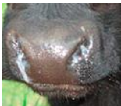
Izdalījumi no deguna.

Vietējais process. Dzīvnieka vispārīgais veselības stāvoklis ir labs. Dzīvnieku drīkst pārvadāt.