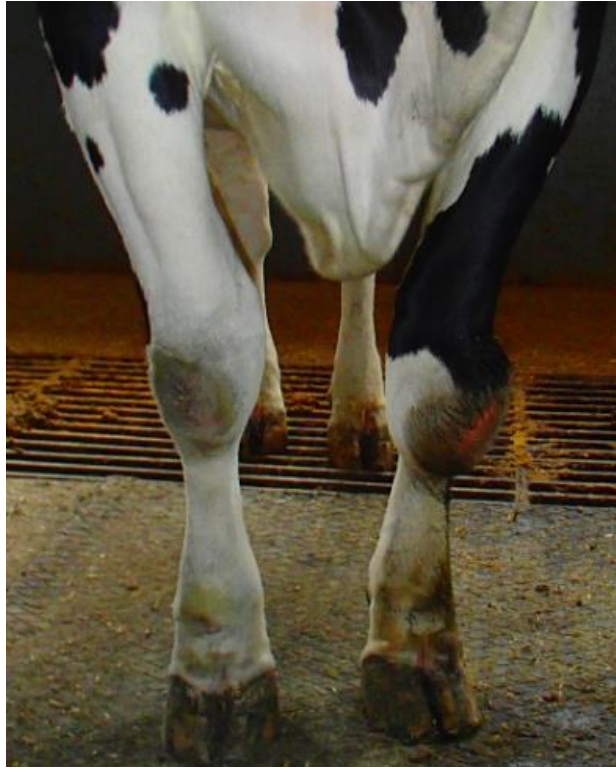
Neliela, virspusēja brūce. Tiek skarta tikai āda. Neliela asiņošana. Dzīvnieku drīkst pārvadāt.