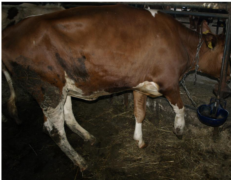
Novirzīts ķermeņa svars. Sargā labo priekškāju.